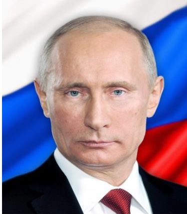
ПРЕЗИДЕНТ РОССИЙСКОЙ ФЕДЕРАЦИИ ПУТИН ВЛАДИМИР ВЛАДИМИРОВИЧ