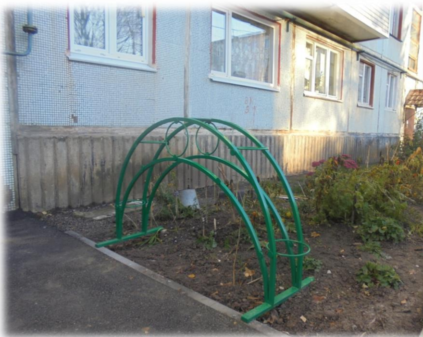
Декоративные арки под цветы